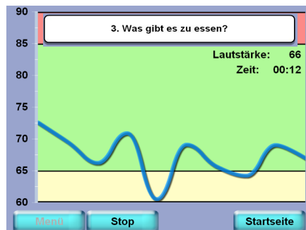
LSVT Companion zeigt die Messergebnisse an, während der Patient phoniert.

Während der Therapie zeigt LSVT Companion die wichtigsten Messwerte wie Lautstärke (dB), Tonhöhe (Frequenz) und Dauer (Sek.) der Leistungen an, die Ihr Patient während der Stimm- und Sprachübungen produziert. LSVT Companion enthält ein kalibriertes Mikrophon, das die Genauigkeit der Messergebnisse sicherstellt. Zusätzlich werden alle Messdaten jeder Übung in einer Excel-Datei gespeichert, um die Therapieerfolge Ihres Patienten evaluieren und verfolgen zu können. Der Vergleich der Patientendaten ermöglicht Ihnen, den Therapieplan exakt auf die Bedürfnisse des Patienten abzustimmen.